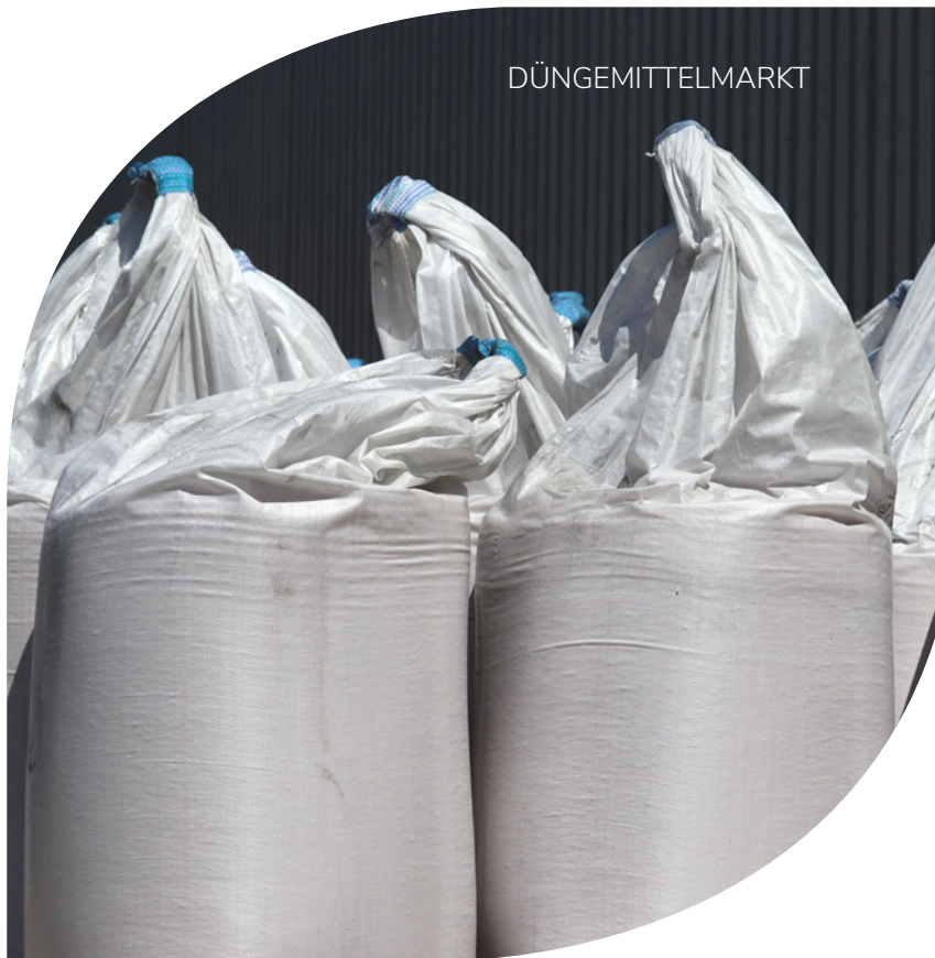
Entwicklung des Düngemittelabsatzes in Deutschland in Millionen Tonnen

*Abweichung zur Vorjahresmeldung aufgrund Korrekturen und Nachmeldungen